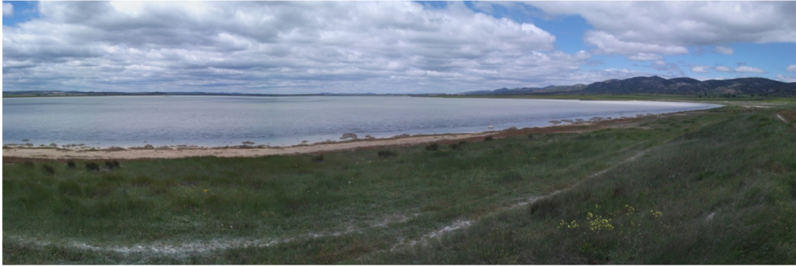
Vista de la laguna en mayo de 2013