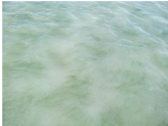
Imagen de los hidrófitos presentes en la Laguna de Gallocanta en el muestreo de mayo de 2013