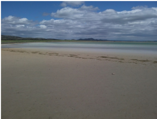
Vista de la laguna y de la zona litoral en mayo de 2013