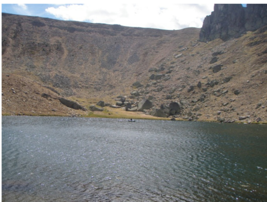
Muestreo en embarcación. 29/08/2012