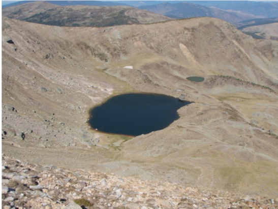
Vista de la laguna desde el pico Urbión. 29/08/2012