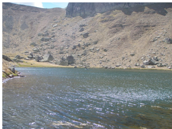
Vista de la laguna desde el litoral.