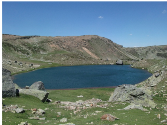
Vista de la laguna desde el litoral. 25/07/2013.