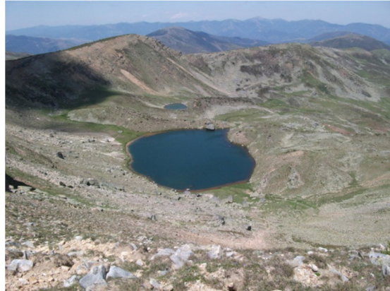
Vista de la laguna desde el pico Urbión. 25/07/2013