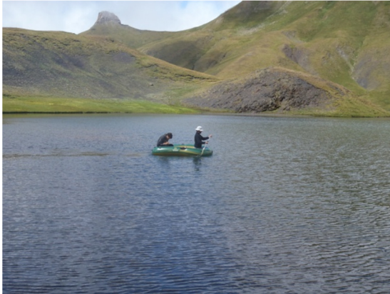
Imagen de la embarcación realizando los transectos de profundidad