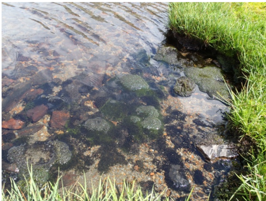
Imagen del litoral del lago