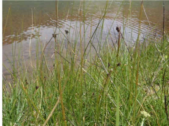
Vegetación de la zona litoral del lago