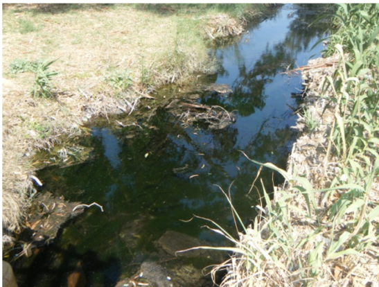
Canal de drenaje.