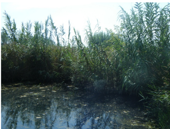
Turbidez por restos vegetales en superficie.