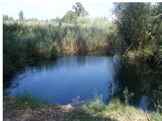
Cinturón de helófitos en uno de los "ullals".