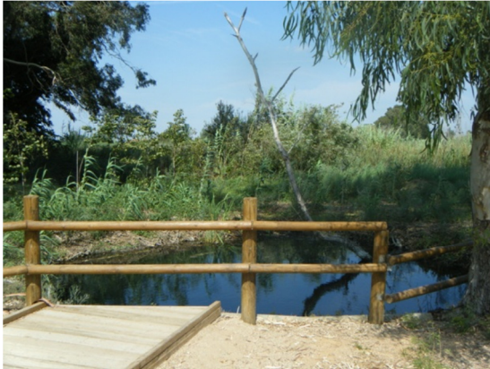
Infraestructuras en el litoral de uno de los "ullals".