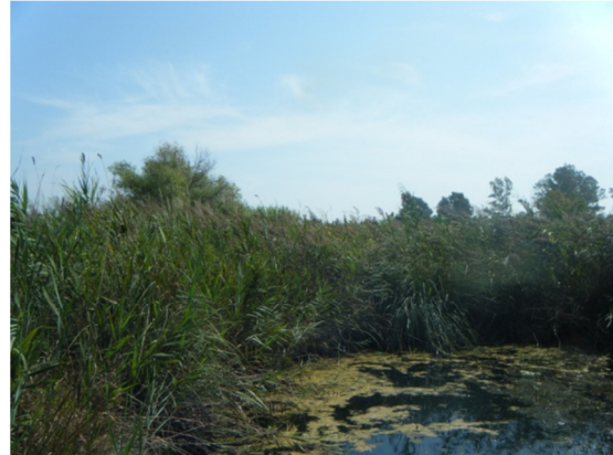
Restos vegetales en la superficie de un "ullal".