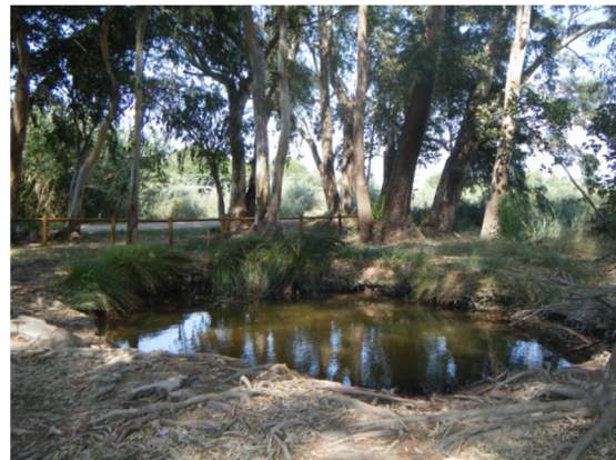
Plantación de árboles exóticos (eucalipto).